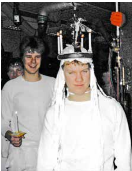
Luciatåg redo för avmarsch mot fikarummet.

De var heller aldrig svår att övertala grabbarna till lite ”upptåg” exempelvis att lussa för skolchefen och övrig personal under fikan och med levande ljus i luciakronan konstruerad av blykabel. Från en medhavd bricka överräckte lucia högtidligt ett glas extra kryddad julbrygd till skolchefen att smaka på under luciätågets skönsång!