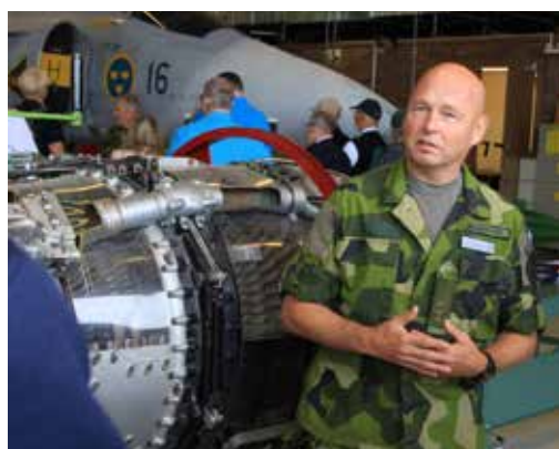
Förmiddagen bjöd på demonstration av flygteknisk utbildning och räddningstjänst.