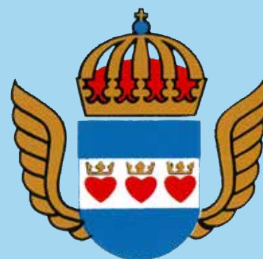
Flottiljkommandos Kamrat- och Veteranförening Halmstad