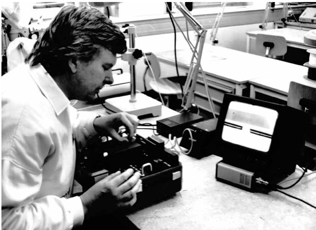
Skribenten demonstrerar svetsning av optofiber.

överföring via optofiber började ta fart i början av nittiotalet, intresset för den nya tekniken var stort, och även försvaret kom i gång med installationer. Innebar behov att bygga upp utbildningsresurser, ett uppdrag som gavs till ITS. Fanns på den tiden inte mycket anpassat för praktikutbildning att anskaffa på marknaden, vilket innebar att det fick byggas upp av tekniklärarna för att bl.a kunna skarva optofiber och mäta kvaliteten på skarvarna.